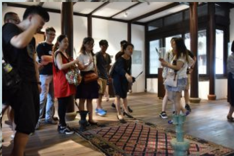
第一届江苏文创设计师培训班